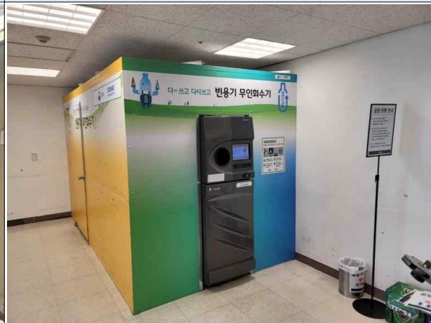
매립형 무인회수기 실내 부스