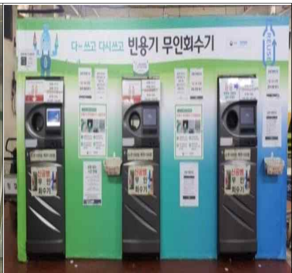
매립형 무인회수기 및 부스