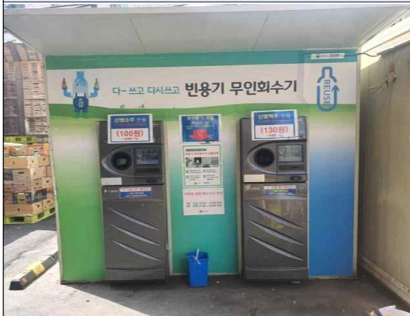
매립형 무인회수기 실외 부스