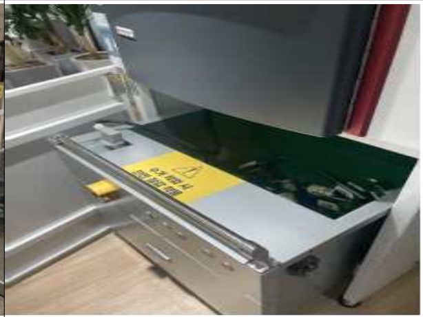
독립형 무인회수기 내부 적재함